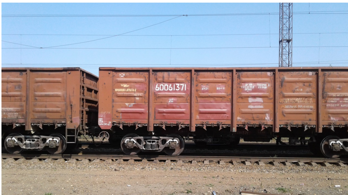
Рис. 1. Полувагоны модели 12-132-03

рожными. Из порожних полувагонов труднее выбраться, если внутри нет поручней-ступенек, хуже видно и сильнее трясет. В полувагонах перевозящих уголь, антрацит, концентрат железорудный (гематит) лучше не ездить, эти грузы очень сильно пачкают тело. У вагонов-хопперов есть переходная площадка, на которой удобно ехать. В них перевозят минеральные удобрения, зерно, цемент и др. грузы. С вагонов-хопперов открывается широкий обзор забираться и слезать с них гораздо легче чем с полувагонов. Но к сожалению едущего на них видно тоже лучше. Платформы бывают с настилом пола и без. Порожние платформы с настилом пола пригодны для езды. Грузенные крытые вагоны всегда закрыты ЗПУ. Некоторые порожние крытые вагоны тоже закрывают закрутками. Ехать внутри крытого вагона очень шумно. Это не так романтично, как некоторым кажется. Если вы выбрали крытый вагон для езды, то отоприте дверные закидки с обеих дверей, чтобы можно было сойти с удобной стороны. Еще встречаются модели крытых вагонов 11-276, 11-286 с переходными площадками и сиденьем. На мой взгляд эти вагоны самые комфортные для езды.