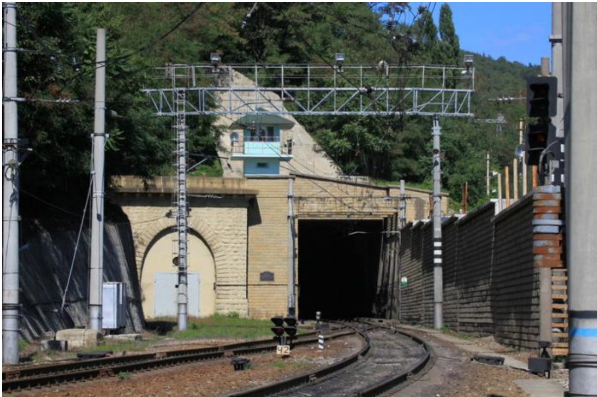
Рис. 6. Пост по охране тоннеля. Разъезд Индюк, большой петлевой тоннель.

– охраняемые искусственные сооружения. Контроль осуществляется работником ФГП ВО ЖДТ России. В случае обнаружения проезда посторонних людей в грузовом поезде он обязан доложить об этом начальнику караула, а тот в свою очередь доложит ДСП, через которого будет следовать поезд, и начальнику караула ведомственной охраны на этой станции для принятия мер. Некоторые посты по охране тоннелей расположены на надтоннельной площадке (рис. 6). Работники ФГП ВО ЖДТ России иногда осматривают территорию станции с пешеходных мостов. Содержимое полувагонов с моста прекрасно видно.