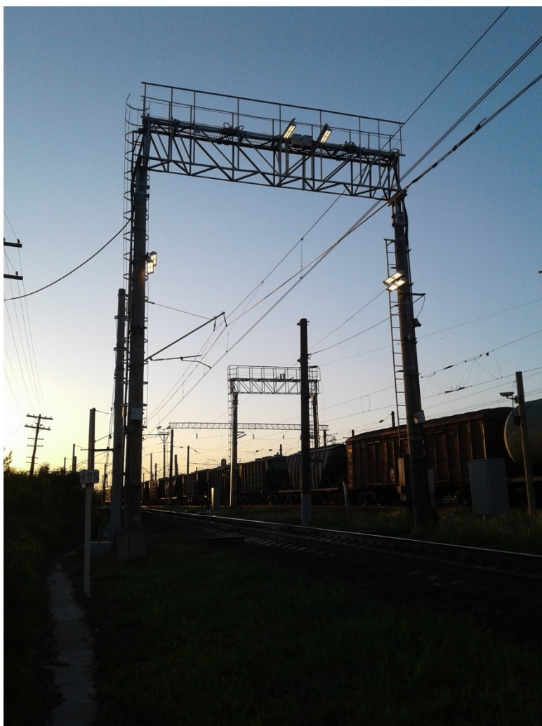
Рис. 5. АСКО ПВ на ст. Рыбное, парк «А»

Если на впереди лежащей станции заняты пути приема, то поезда могут простаивать на соседних станциях, или на перегоне перед проходными светофорами.