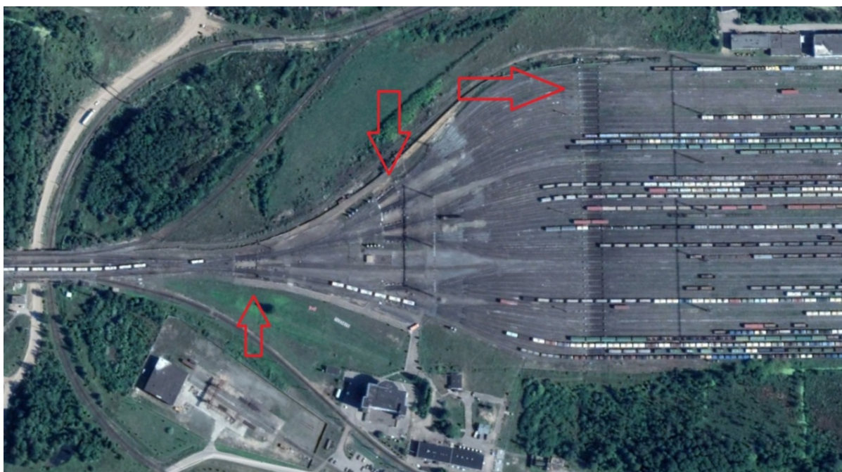
Рис. 2. Вагонные замедлители на ст. Бекасово-Сортировочное

парка, который может быть объединен с парком приема (например Рыбное, парк «А»), парком отправления (Бекасово-Сортировочное, парк «В»), располагаться параллельно сортировочному (Орехово-Зуево, парк «Т»), либо парку отправления (Нижний Новгород-Сортировочный).